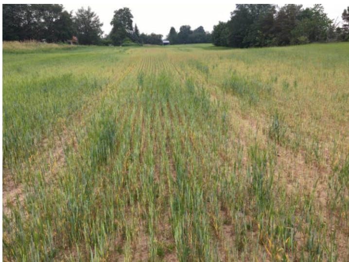
Billede 1 og 2. Vårbygmark sæsonen 2019 stærkt medtaget af kalkmangel – rødder meget fortykkede og ingen ordentlig næringsoptag af øvrige næringsstoffer.