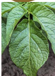
Indflyvning af cikader