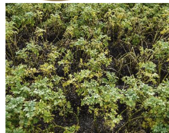
For tidlig nedvisning pga. cikader