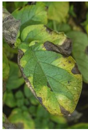
Symtomer på sugning af cikadenymfer