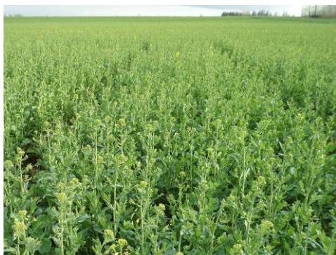
Billede 2. Når der ses gult i de første gule blomsterknopper, som i marken her, er det for sent at anvende Matrigon.

effekten ikke altid tilfredsstillende. Vær i god tid før st. 55 klar til at udnytte en dag med bedst mulige dag- og nattemperaturer i dagene før og efter sprøjtningen. Sprøjt gerne først på dagen, så midlet optages under stigende temperaturer.