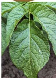
Indflyvning af cikader