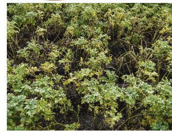
For tidlig nedvisning pga. cikader